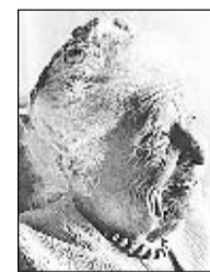
Ida Rolf (1896–1979), Begründerin von Rolfing.

Ida Rolf entwickelte eine Abfolge von zehn systematisch aufeinanderfolgenden Sitzungen, in denen die optimale Struktur, die Haltung und Bewegungsform des Klienten analysiert und verbessert wird. Rolfing ist vordergründig also eine körperliche Behandlung, gleichzeitig aber auch eine Wahrnehmungs- und Bewegungsschulung, die den Körper zurück in eine Balance bringen soll. Eine Zeitlang war Rolf sogar in Hollywood populär: Marlene Dietrich, Greta Garbo und Cary Grant ließen sich „rolfen“ und trugen zur Bekanntheit in den USA bei. Einer von Rolfs berühmten Schülern war Fritz Perls, Begründer der Gestalttherapie . Anfang der 70er-Jahre gründete Ida Rolf in Boulder, Colorado das Rolf Institute, das bis heute ihr Wissen über strukturelle Integration weitergibt. Nach Ida Rolfs Tod wurde ihre Methode unter dem Namen Rolfing weltweit bekannt. (pok)